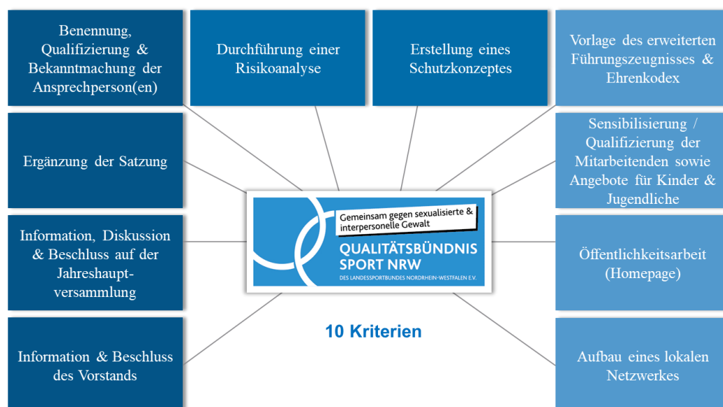
Abb.1 Die Kriterien für die Mitgliedschaft im Qualitätsbündnis

Die nachfolgende Abbildung zeigt eine Übersicht aller Kriterien: